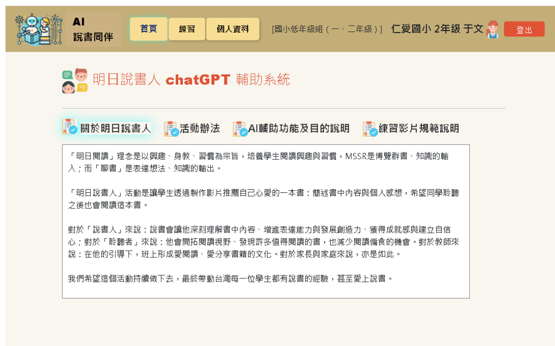
圖 3-1 首頁頁面